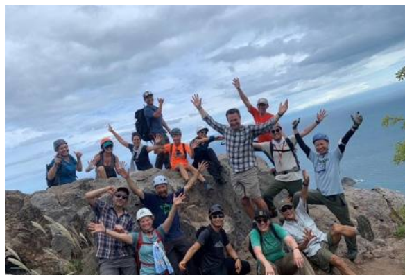
D0A10：港町小樽で海と断崖の絶景トレッキング