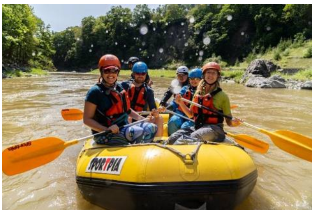
PSA8：日本最北の地を目指して 上川・宗谷 カヌーとサイクリング