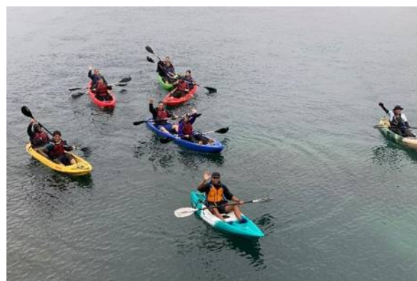
D0A8：ゼロカーボンパーク支笏湖 苔の回廊ハイキングとクリアカヤック