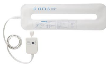
見守り支援システム