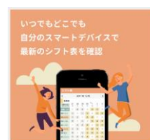
勤務シフトアプリ