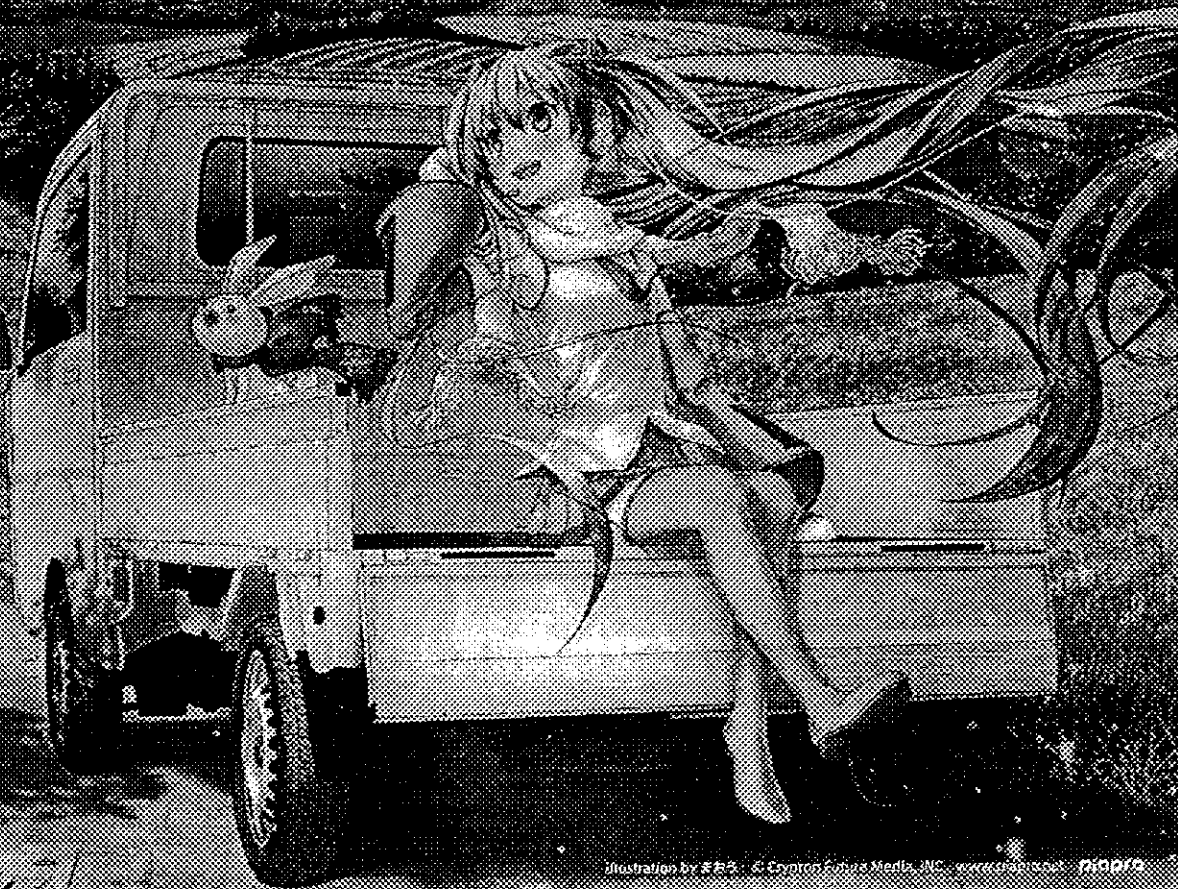
Illustration by まねろ. © Crypton Future Media, INC. www.maimai.com 2017/03