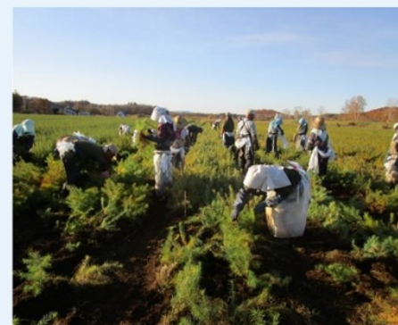
作品名：苗畑の秋

作業後、今日頑張ってくれた重機に声をかけている一コマ。重機を仕事のパートナーとして大切にしていることが伝わります。