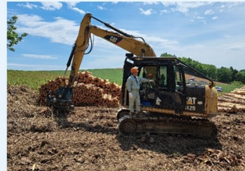
作品名：お疲れ様、また明日

作業後、今日頑張ってくれた重機に声をかけている一コマ。重機を仕事のパートナーとして大切にしていることが伝わります。