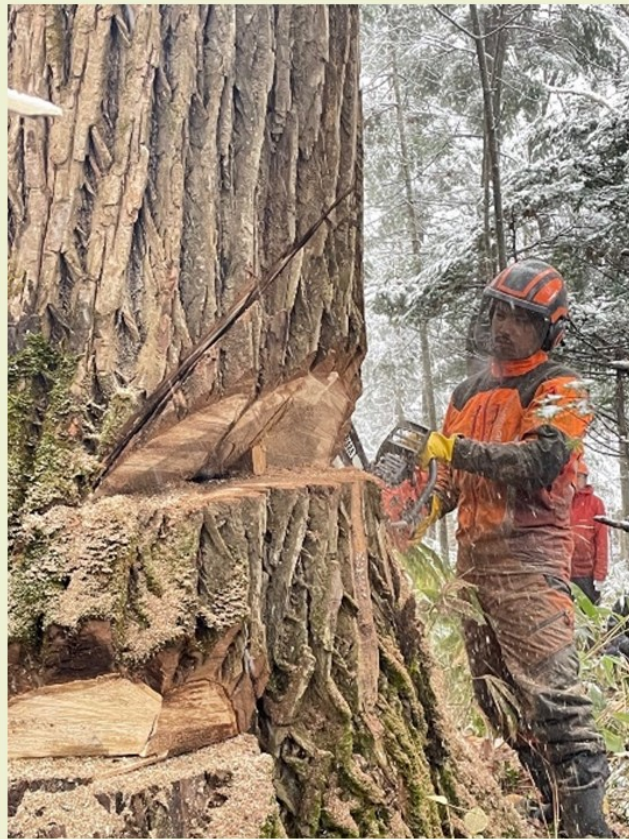
作品名：巨木、伐倒。