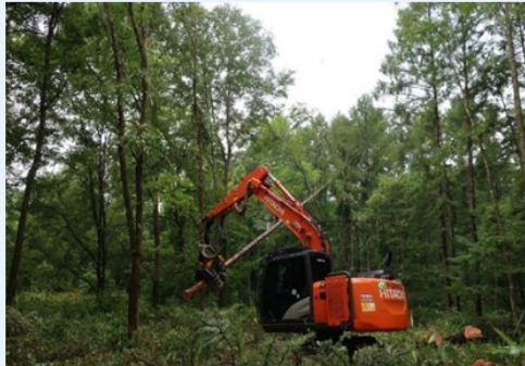
作品名：森林で働くハーベスタ

伐倒するのは一瞬の出来事なので、今までの経験の感覚を使って正確に作業しているのだらうと、感じながら撮りました。