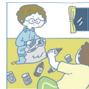
アルコール・薬物・ギャンブル問題を抱える家族の面影を見ている