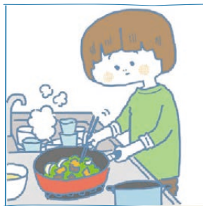
病気や障がいのある家族のために、家事をしている