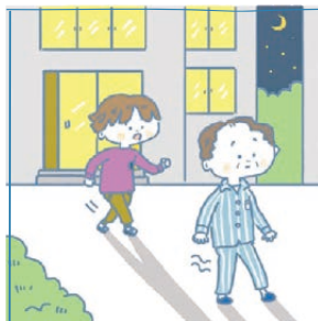
目が離せない家族の見守りや声かけなどの気づかいをしている