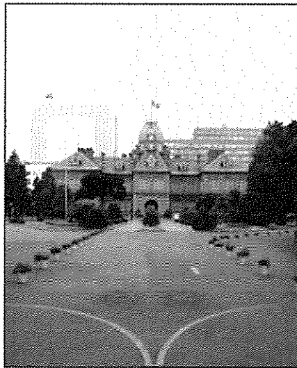
旧本庁舎 Former Hokkaido Government Office Building

With both start and finish lines in Odori Park, runners followed a course along a loop of approximately 20 km and then repeated a loop of approximately 10 km. The course included historical areas from the founding of Sapporo and Hokkaido, such as Susukino, Nakajima Park, Souzenwa-dori, Hokkaido University, and the former Hokkaido Governmental Office Building (Red Brick Office), promoting the city's appeal to the world. The section of the Hokkaido Government grounds was decorated with welcome flowers and marigolds, and runners ran through from the north to the east gates.