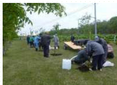
自社敷地内の植樹 <宣誓項目(12)>