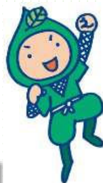
環境忍者 えこ之助