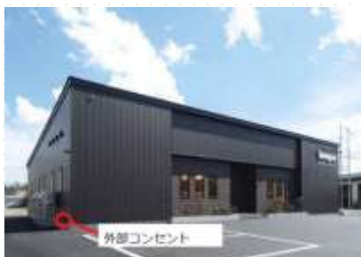
EV導入を見据え、社屋に外部 コンセントを設置<宣誓項目(8)>