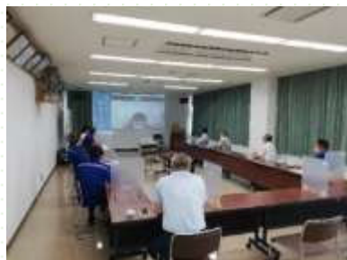
施工現場とのオンライン会議化 <宣誓項目(3)>

ゼロカーボン・チャレンジャーの 取組 は、道の ホームページ で 紹介 しています。