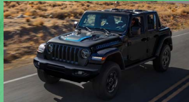
ジープ ラングラー 4xe

場所 札幌市北3条広場[アカプラ] 札幌市中央区北2条西4丁目 ※悪天候の場合は中止することがございます