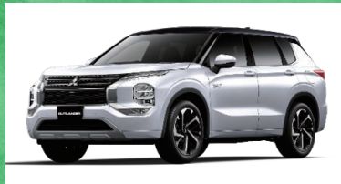
三菱 アウトランダーPHEV