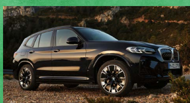
BMW iX3 M Sport