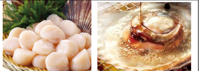
▲メニューは「ホタテごはん」「ホタテのスープ」「ホタテの春巻き」「大根とホタテの流水サラダ」の予定です。お楽しみに！