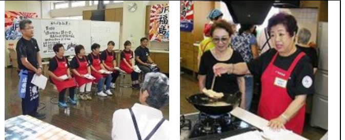
▲北海道の浜のお話しをたっぷり語り合いましょ。生産の現場について、ホタテの美味しさについて、東京で買えるところについて・・・ *写真は前回「浜のかあさん」の際の撮影です。