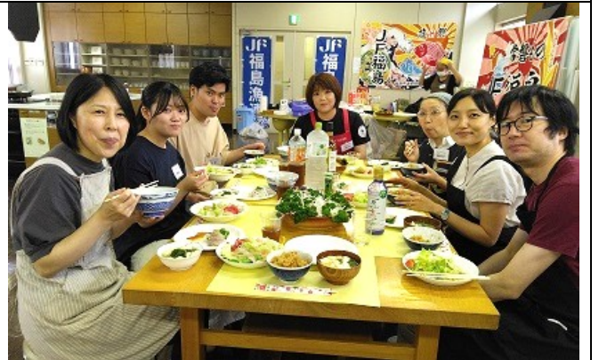
▲お料理ができたならみんなで試食会。北海道かあさんの自慢料理を囲みましょう。