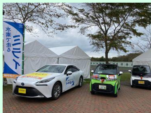
▲水素燃料電池自動車(FCV)と電気自動車(C+pod)

●FCVの外部給電機能を使って、胆振総合振興局環境生活課のブースに電気を供給しました。