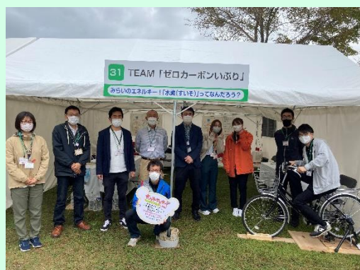
▲TEAM「ゼロカーボンいぶり」メンバーで出展しました!

●多くの方に水素や再生可能エネルギーをもっと身近なものとして感じていただけるようにイベントを実施しました。