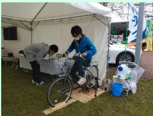
▲自転車で自家発電体験

●多くの方に水素や再生可能エネルギーをもっと身近なものとして感じていただけるようにイベントを実施しました。