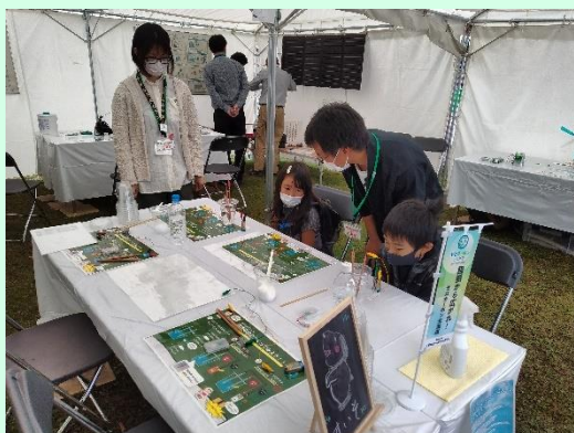
▲水素燃料電池の作成体験