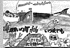
2021年度 優秀作品 (小学生)