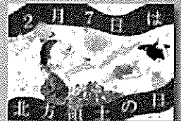
2021年度 最優秀作品 (中学生)