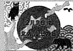
2021年度 最優秀作品 (小学生)