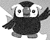
北方領土のイメージキャラクター スとびりかの「エリカちゃん」