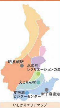
いしかりエリアマップ