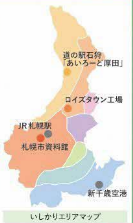
いしかりエリアマップ