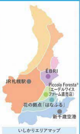
いしかりエリアマップ