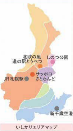
いしかりエリアマップ