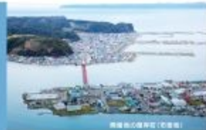
北海道の漁港(苫小牧)

水産資源の保護・管理と海や湖沼・河川の環境保全の大切さを広く国民に訴えらるとともに、つくり育てる漁業の推進を通じて、明日のわが国漁業の振興と発展を図ることを目的として、昭和56年に第1回大会が大分県で開催されて以来、継続して各地で開催されています。北海道では、昭和60年の第5回大会(釧路町豊栄床漁港)以来、2回目の開催となります。