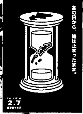
2022年度 最優秀賞（総合）