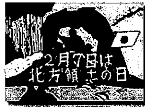
2022年度 優秀賞（中学生）