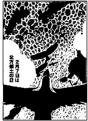
2022年度 最優秀賞（大学・専門学校の部）