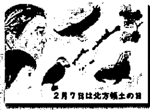
2022年度 優秀賞（小学生）