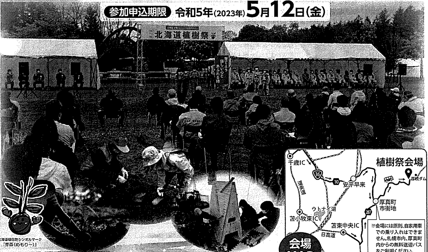
北海道植樹祭シンボルマーク「芽森(めもろー)」