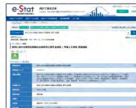
図表1 政府統計総合サイト e-Stat | https://www.e-stat.go.jp

まず、平成30年度(2019年12月公開)の「 都道府県別「コンピュータの設置状況」及び「インターネット接続状況」の実態(高等学校) 」のExcelデータをダウンロードしよう。最初にRで分析する前にデータクレンジングの作業が必要である。データクレンジングは、表計算ソフトウェア上で行うのが有効である。今回は次のような整理、整形を行った。