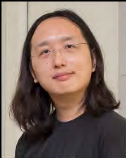
台湾デジタル担当大臣 オードリー・タン