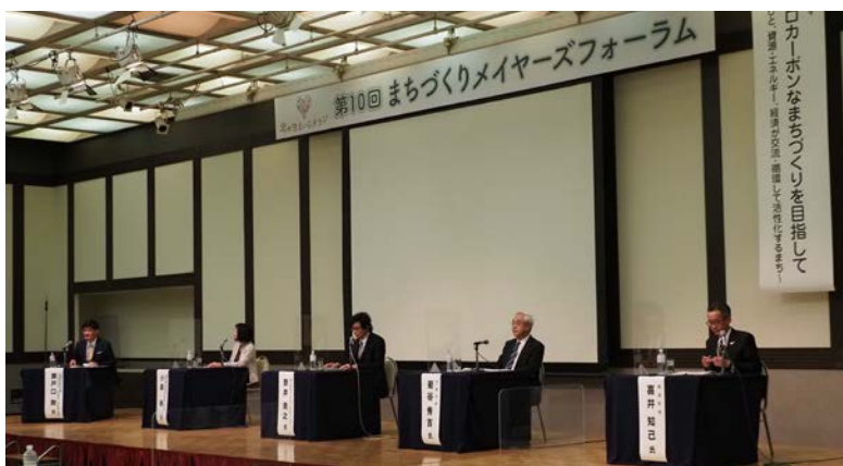
第10回メイヤーズフォーラムのようす

主催は北海道、一般財団法人北海道建設技術センター。共催として北海道大学大学院工学研究院。