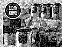
北海道プロダクトの「ベビーポタージュスープ」のご提供 ベビーポタージュスープ 1,203円(税別)