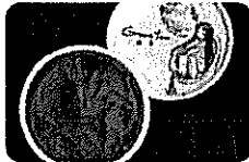
イノヴェック 抹茶ジェラート 936円