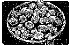
池田食品 豆麹入 焼ほたて豆 595円