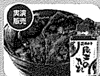
北海道足寄町の精製豚の子の「豚汁のたれ」を使った豚汁を実演販売 豚汁 1杯 2,941円(税別) 豚汁のたれ 2,540円(税別)