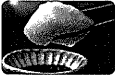
マルタカ高田食品 冷凍ホタテ貝柱 13,103円