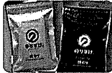
ダイホク のりすけ手巻寿司用50枚 7,218円 のりすけ手巻寿司用50枚プレミアム 9,224円