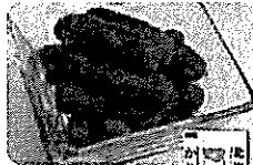
浜塚製菓 北海道濃厚ミルク かりんとう 949円