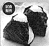
ダイホクの「のりすしけ」をおにぎりにしてご提供

ホノルルのヤングストリート沿いに位置し、ハワイ在住の日本人を始め日本人やローカルの方も多く利用する高級日系スーパー。生鮮品や日本各地の特産品、お弁当等を取り扱いますが、最近では店内に居酒屋もOPEN。