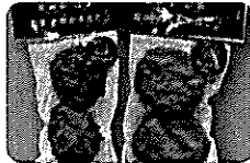
友柴太田かまぼこ いが天かまぼこ 1,738円 ほたて天かまぼこ 1,337円