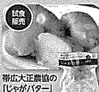
帯広大正農協の「じゃがバター」をご提供 帯広大正農協の大正メーグインでつくったじゃがバター 906円(税別)