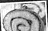
北海道銘産「よいとまけ」とコーヒーのセット 1人前 855円(税別)