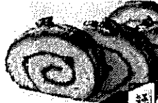
三星 よいとまけ 2,674円