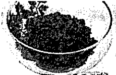
竹田食品 かにみそ 1,250円