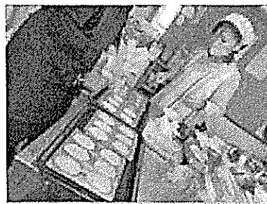
「就労の準備段階として支援する『しごと練習喫茶 まるくる』」の様子