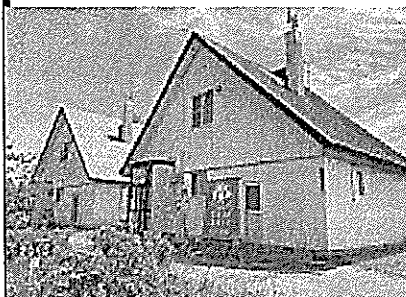
「相談室まるしえ」と「Cafe まるくる」の外観

石狩市において、市内や周辺地域に暮らす不登校・ひきこもりの子どもや若者、その家族を対象に「相談活動」と「居場所活動」を中心とした支援活動を行っている団体です。平成26年度から石狩市の委託を受け、「相談室まるしえ」、「Cafe まるくる」という“家”を拠点として、不登校やひきこもりに関する相談、当事者の成長自立の支援、関係機関と連携した包括的な支援体制づくり、ひきこもり等に関する普及啓発などの広範な業務を総合的・一元的に行っています。様々な“困り感”を抱えている当事者や家族と、『ともに考え、行動し、寄り添いながら』をモットーに、当事者等の状態や目標に対応したメニューを用意して進められるサポートがジェルメ・まるしえの特徴です。相談をはじめとした地道な支援により、約4割の方が自立に至っています。行政と緊密に連携し、「ひきこもり」などについての住民理解を深める活動にも取り組むジェルメ・まるしえは、困難を有する子ども・若者や家族を支援するモデル的な取組となっています。