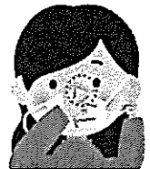
0密の形に合わせ すき間をふさぐ