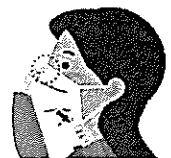
0密の形に合わせ あご下まで伸ばし顔に すき間なくフィットさせる