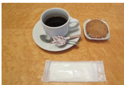
⑦A セット【ホットドリンク （コーヒー・紅茶）＋クッキー】