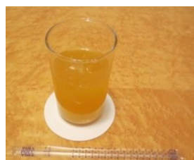
⑥オレンジジュース