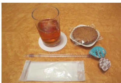
⑧B セット【アイズドリンク （コーヒー・紅茶）＋クッキー】