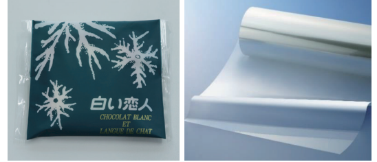
▲再生樹脂を使用した個包装フィルムと原材料のフィルムイメージ

当社とTOPPANが企画・開発した再生樹脂を使用したフィルムを「白い恋人」の個包装に採用。本フィルムを使用することにより、従来のフィルムを使用した時と比較し、バージンプラスチック(※)使用量を年間約40トン、CO 2 排出量を年間約46トン削減することを見込んでいます。また、インクの一部に植物由来原料を使用しています。