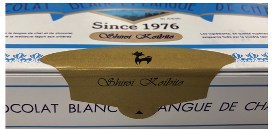
▲化粧箱に使用する紙製の留めシール

プラスチック素材使用量削減のため、「白い恋人」の化粧箱に使用する留めシールをプラスチック(PP)製から紙製に順次切り替えを行いました。従来「白い恋人」で採用してきたプラスチック製の留めシールを紙製に変更することで年間約1.5トンの(2019年度仕入れベース)プラスチック素材の使用を削減することができます。