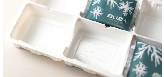
▲バイオマス素材を主原料にしたトレー

「白い恋人」や「美冬(みふゆ)」などの生産量が多い商品には「バイオマス素材(植物由来)」を主原料としたトレーを採用しています。バイオマス素材とは、多くが植物から作られる素材です。植物は成長の過程でCO 2 を吸収しているため、カーボンニュートラルな素材とされており脱炭素化に繋がります。