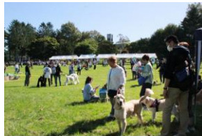
2023動物愛護 フェスティバル in えべつ