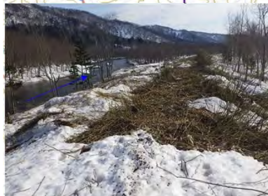
伐木 (宗谷総合振興局)