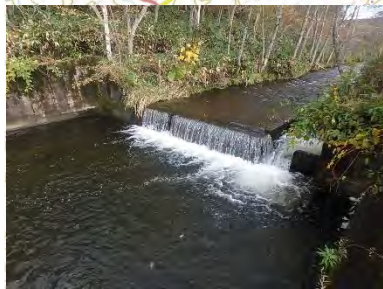
魚道工の整備 (宗谷総合振興局)

○令和元年東日本台風等、全国各地で甚大な被害が発生している。今後、徳志別川水系の流域においても気候変動の影響により降雨量が増大し、水害が激甚化・頻発化する恐れがある。このような水災害リスクの増大に備えるため、河川等の管理者が行う対策に加え流域全体のあらゆる関係者が協働することで、流域における被害の軽減を図る。