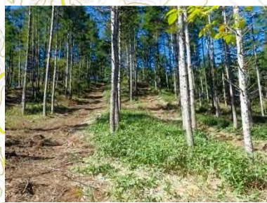
森林整備 (森林整備センター)