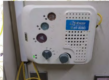
音声告知端末 (枝幸町)