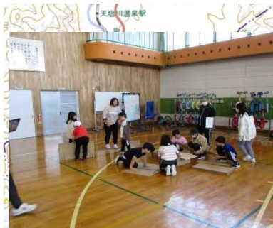
1日防災学校 (枝幸町)