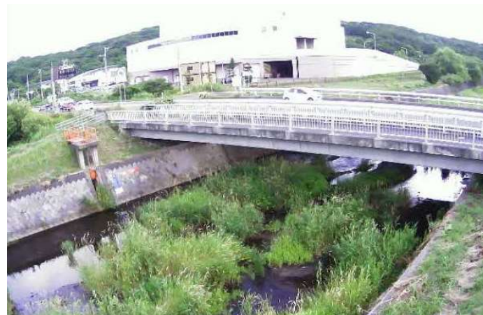
（チマイベツ川）簡易型河川監視カメラによる映像提供