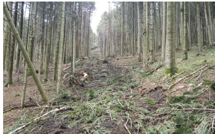
国有林内における間伐の実施 （後志森林管理署）