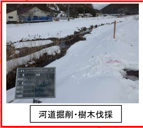
河道掘削・樹木伐採