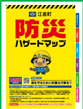
ハザードマップ 作成・周知