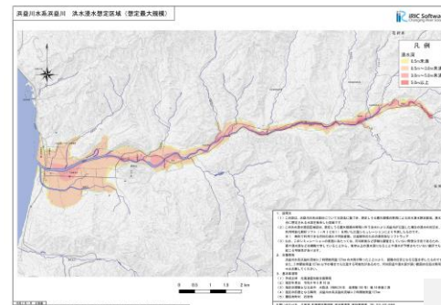
洪水浸水想定区域図 (iRIC)