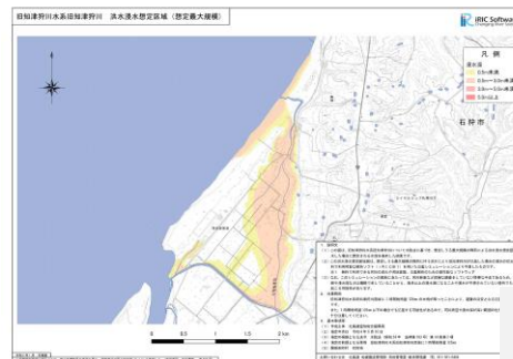
洪水浸水想定区域図 (IRIC)